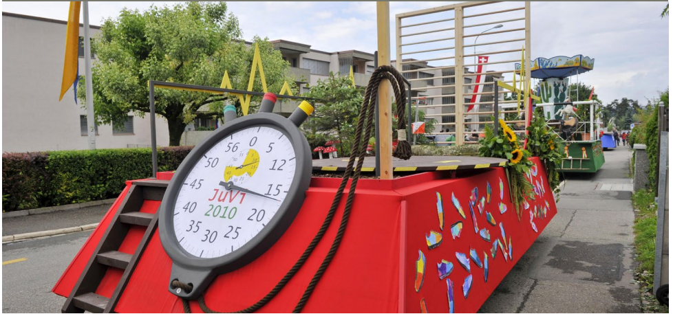
Der Countdown für den Jugendfest-Umzug 2018 läuft – hier ein Bild aus dem Jahr 2010.