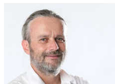
Matthias Walti Werbung