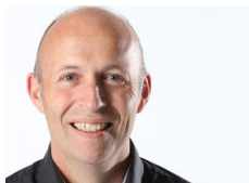
Peter Meyer Bau